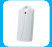
Detector de Temperatura