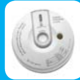
Detector de CO