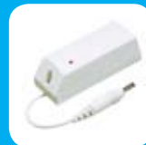
Detector de Inundación