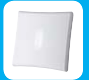
Sirena Interior Inalámbrica

* Lista parcial, contacte con Visonic para obtener información sobre la gama completa de accesorios.