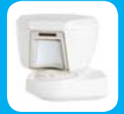
Detector para Exterior