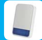
Sirena Externa inalámbrica