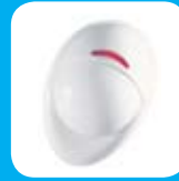
Detector de Movimiento

Amplíe el valor de su oferta recomendando detectores y accesorios inalámbricos