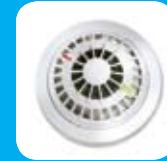
Detector de Humo