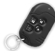
Figura 1. MCT-234

Cada pulsador incorpora un pequeño llavero.