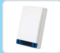
Langaton ulkoinen sireeni