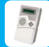
Dwukierunkowa klawiatura LCD