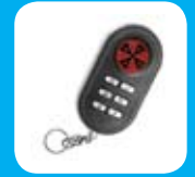
Dwukierunkowy pilot LCD