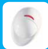
Detector de Movimento

Aumente o valor da sua oferta com estes transmissores e detectores via rádio recomendados.**