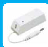
Detector de inundações