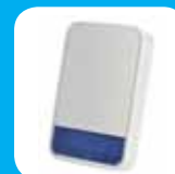
Sirene para exteriores