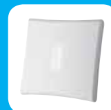
Sirene para interiores

** Todos os módulos de comunicações adicionais devem ser adquiridos em separado.