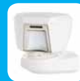
Detector de Exterior