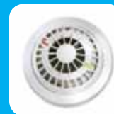
Detector de Fumo