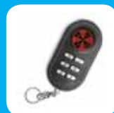
Comando do tipo chaveiro bidireccional