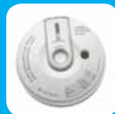
Detector de CO