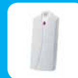
Detector de temperatura